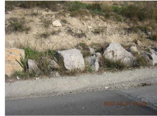
Tram 1: Detall cunetes.