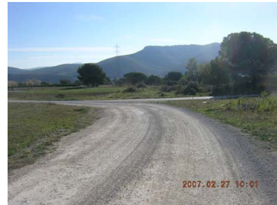
Tram 2: Final de terme.