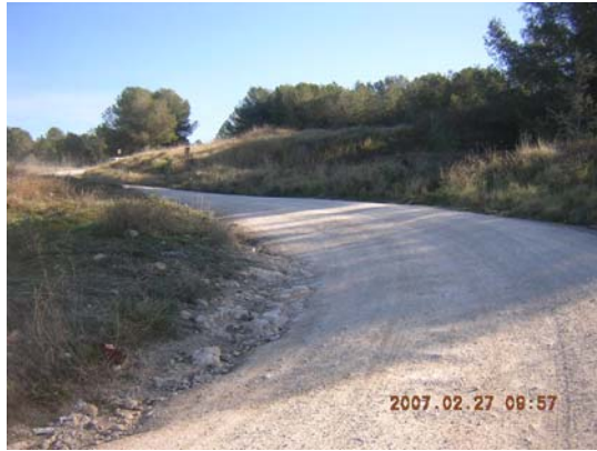
Tram 2: Estat del ferm.