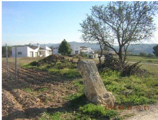
Tram 2: Pedra de terma.