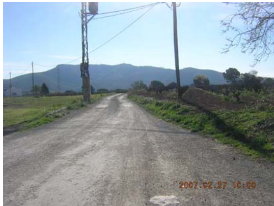
Tram 2: Estat del ferm.