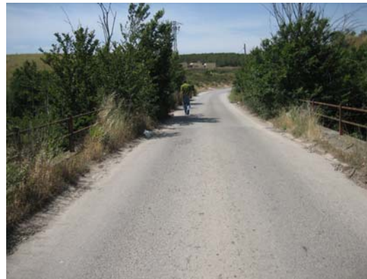
Tram 1: Pont.