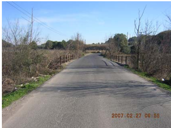
Tram 1: Pont.