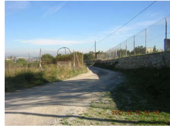
Tram 2: Tram més estret.