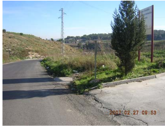
Tram 1: Estat del ferm.