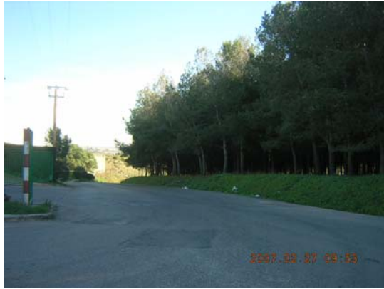
Tram 1: Entrada Planta Triatge.