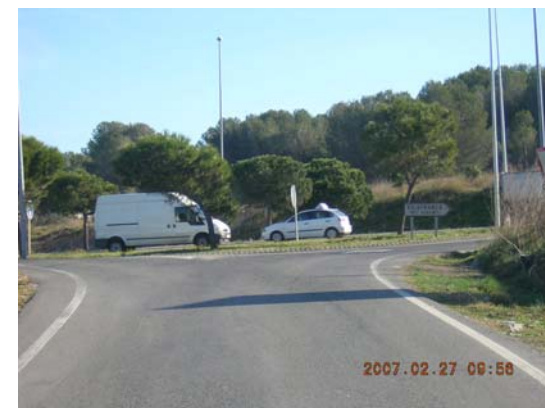
Tram 1: Encreuament C14.