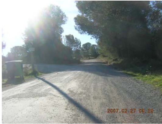
Tram 2: Estat del ferm.