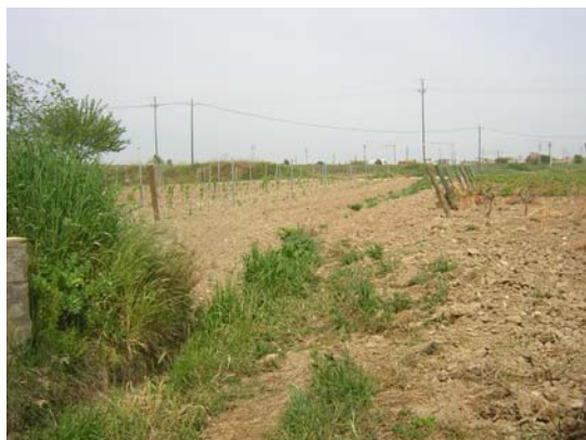
Tram 1: Rasa fins a la riera