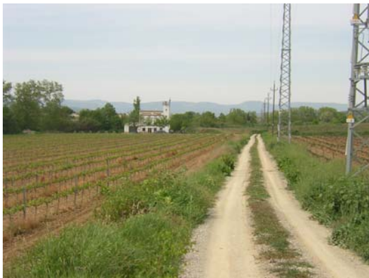
Tram 2: De la Ctra. de la Múnia a Cal Baleta