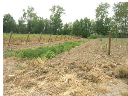
Tram 1: Rasa fins a la riera