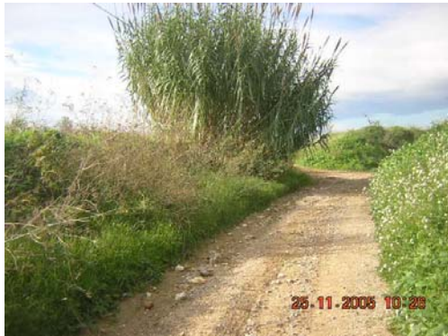
Tram 2: Zona propera al pas de la riera de Llitrà