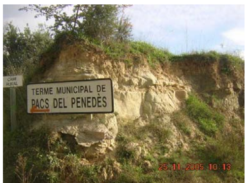
Tram 4: Límit de terme