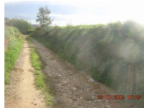
Tram 3: Estat del ferm