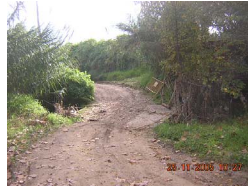
Tram 2: Pas riera Llitrà