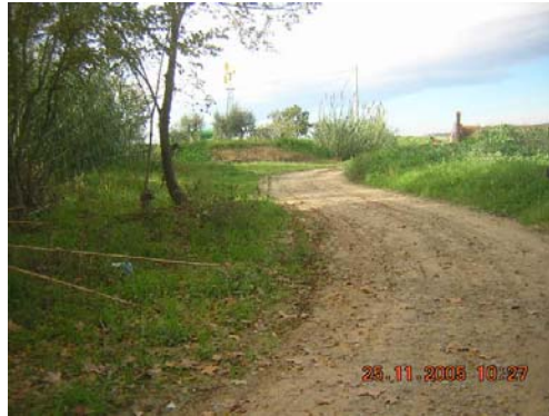
Tram 2: Estat del ferm