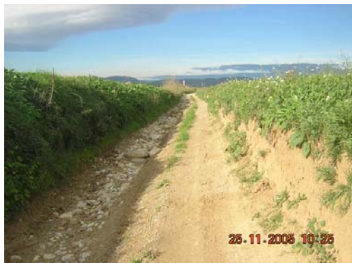
Tram 3: Estat del ferm