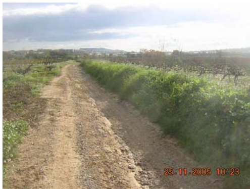
Tram 3: Estat del ferm