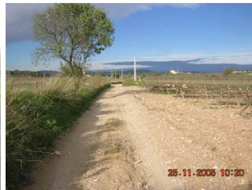
Tram 4: Estat del ferm. Pèrdua marges.