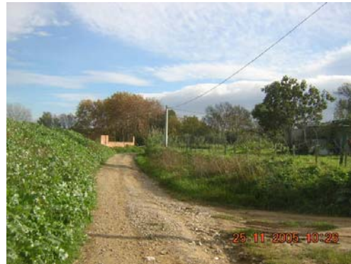
Tram 2: Bifurcació Camí Cal Frare