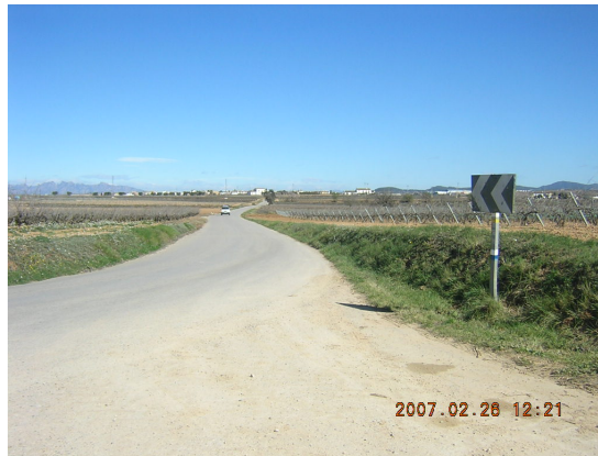
Tram 1: Senyalització vertical.