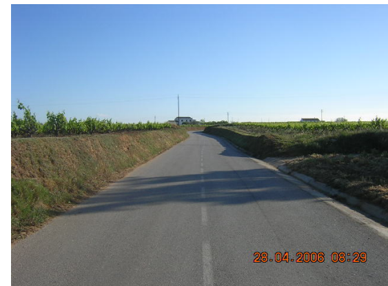
Tram 1: Senyalització horitzontal.