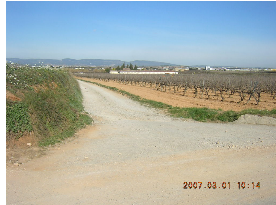
Tram 2: Enllaç Granja Morros.