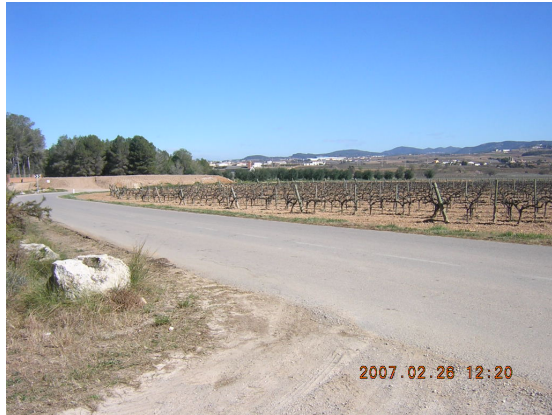
Tram 1: Camí Rossend Montané. Estat del ferm.