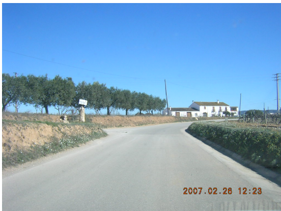
Tram 2: Enllaç camí de Meliό.