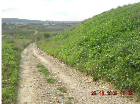
Tram 2. Zona de major pendent