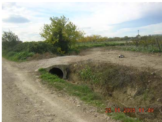
Tram 1. Detall cunetes