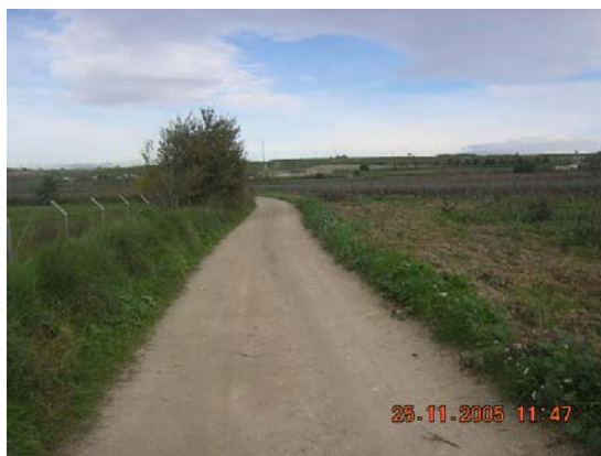
Tram 1. Tipus ferm.