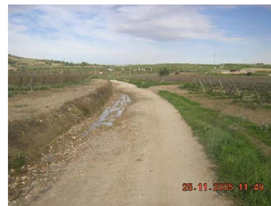
Tram 1: Estat cunetes