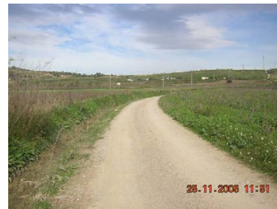
Tram 2. Tipus ferm