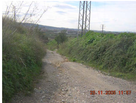
Tram 2: Zona de major pendent