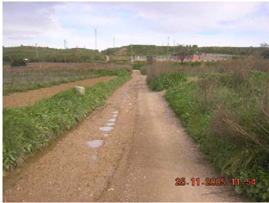
Tram 2: Estat ferm