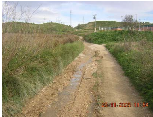
Tram 2. Estat ferm