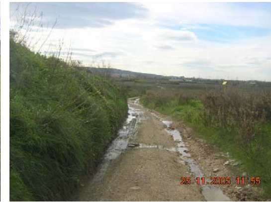
Tram 2: Zona de major pendent