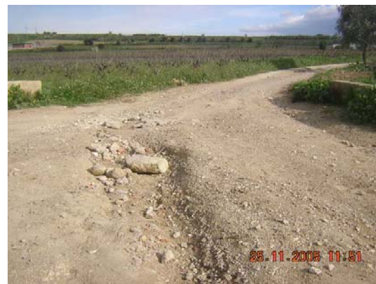
Tram 1: Drenatge transversal