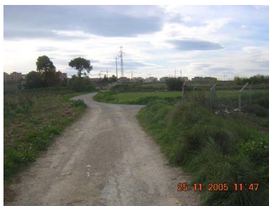
Tram 1. Tipus ferm.