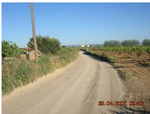
Tram 3: Estat del ferm