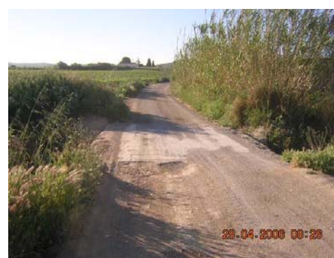
Tram 3: Pontó sobre la riera