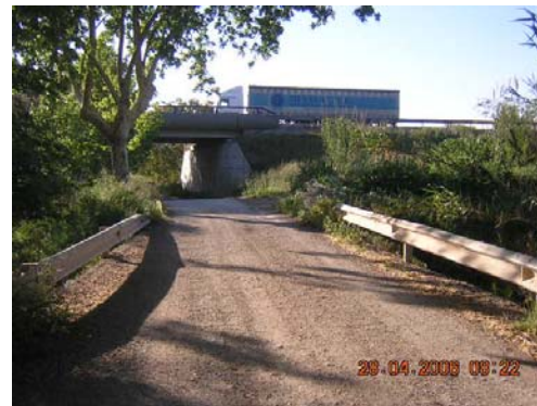
Tram 1: Pas riera Adoberia