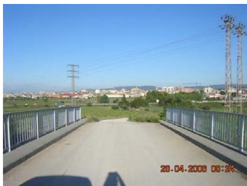
Tram 2: Pont superior AP7