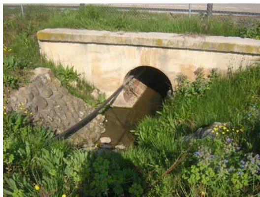
Tram 1: Pas d'aigua N340