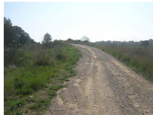
Tram 1: Pas sobre la línia de rodalies RENFE