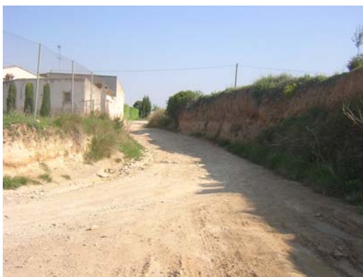
Tram 2: La Casa Nova