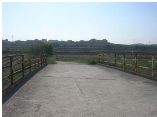
Tram 1: Pas sobre la línia de rodalies RENFE