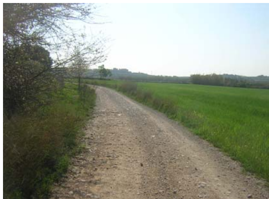
Tram 1: Estat del ferm