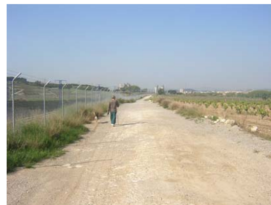
Tram 2: Lateral al TGV