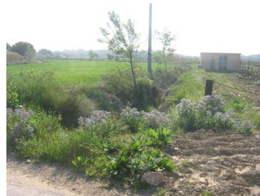
Tram 1: Rasa