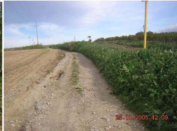
Tram 1. Tipus ferm.