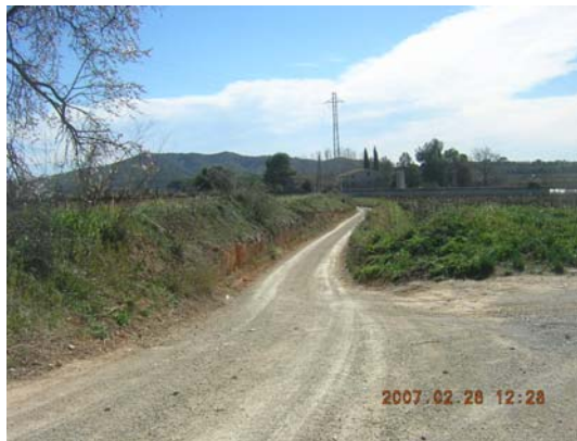
Tram 2: Enllaç amb el camí lateral de l'AP7.