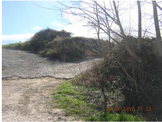
Tram 1: Enllaç amb el camí de Meliό.