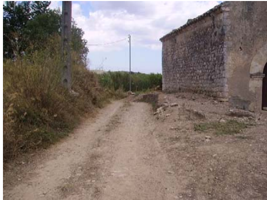
Tram 2: Ermita.