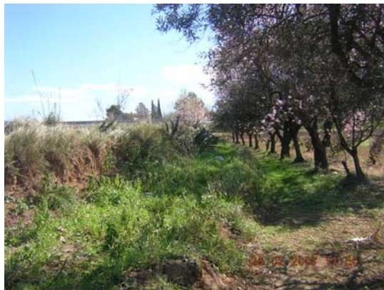
Tram 1: Estat del ferm i marges.