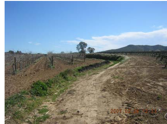
Tram 3: Estat del ferm