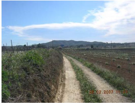
Tram 1: Estat del ferm.