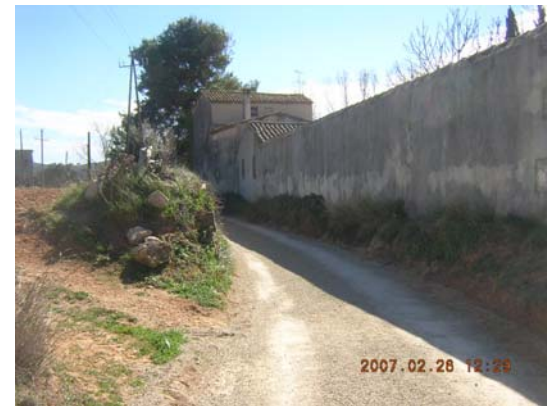
Tram 2: Masia de Santa Maria dels Horts