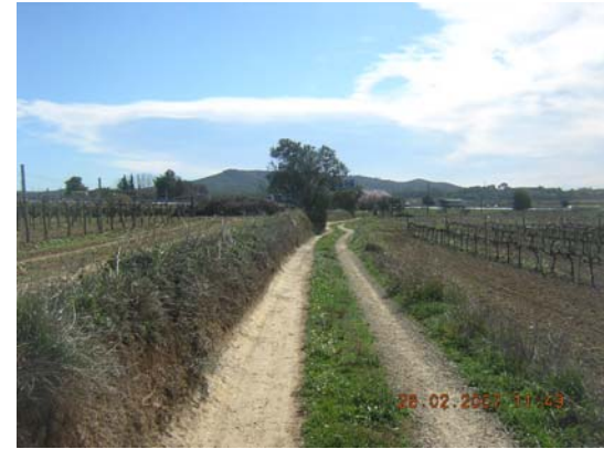
Tram 1: Estat del ferm