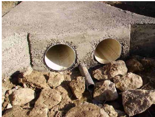
Tram 3: Gual existent.