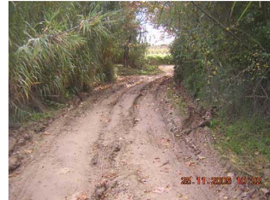
Tram 2: Zona propera al pas de la riera de Llitrà