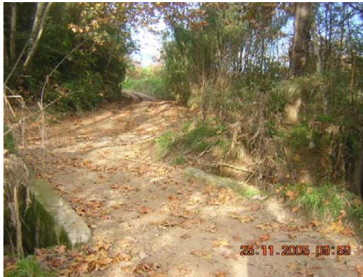
Tram 2: Pas riera de Llitrà