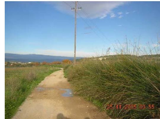
Tram 1: Tipus ferm