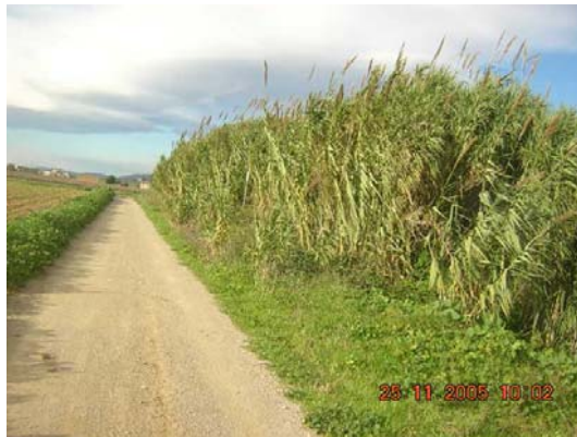
Tram 2: Estat ferm