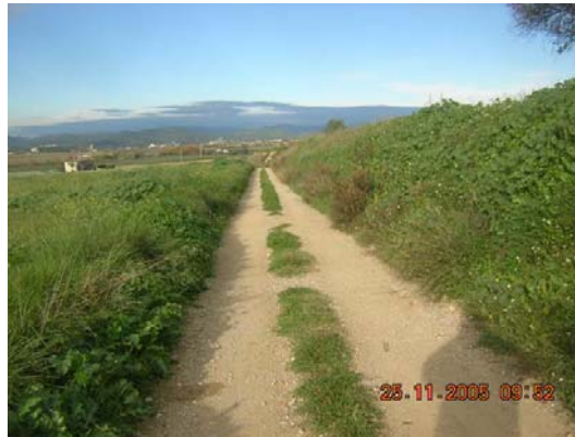
Tram 1: Estat ferm