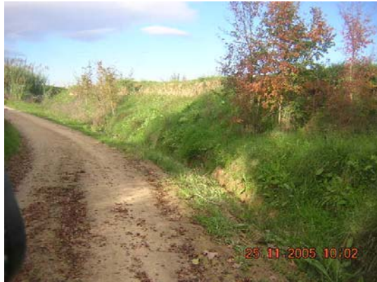
Tram 2: Tram amb cunetes