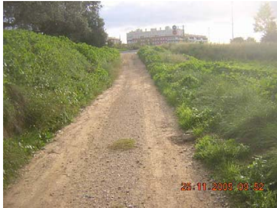
Tram 1: Tipus ferm