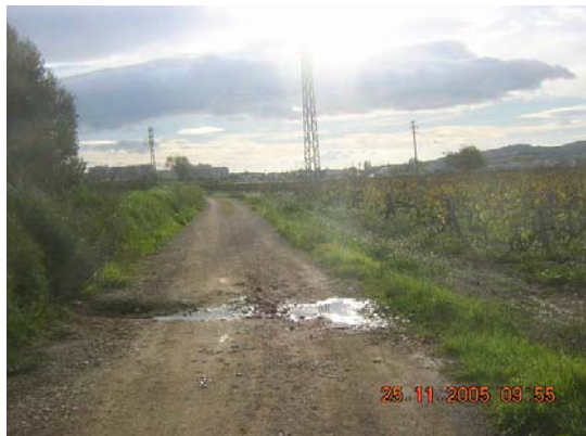
Tram 1: Estat ferm