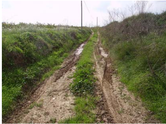
Tram 1: Estat del ferm