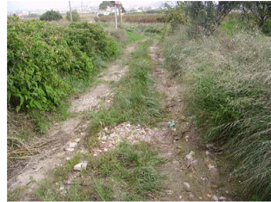
Tram 2: Estat del ferm