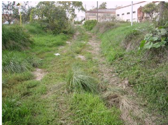
Tram 2: Estat del ferm