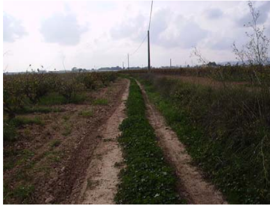
Tram 1: Estat del ferm