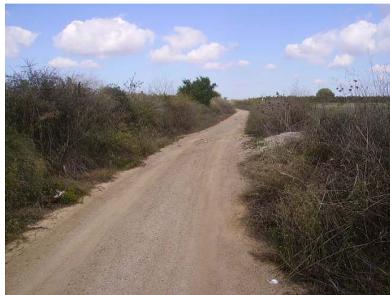
Tram 1: Tipus ferm.