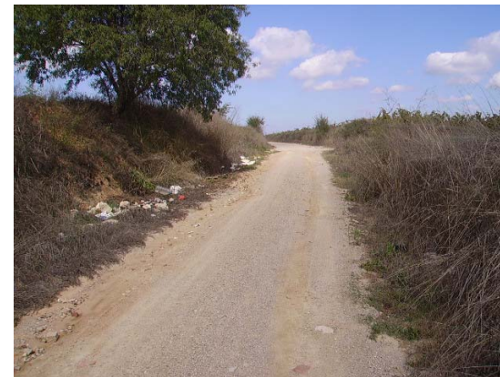
Tram 1. Límit de terme.