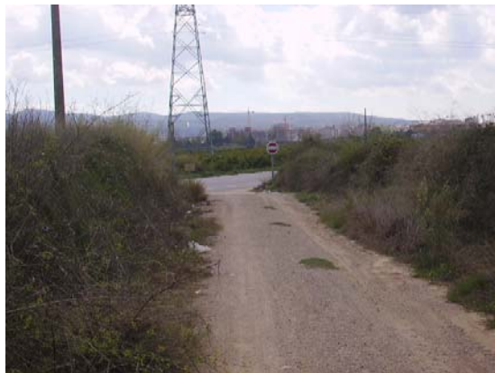
Tram 1. Enllaç Ctra. Sant Sadurní.