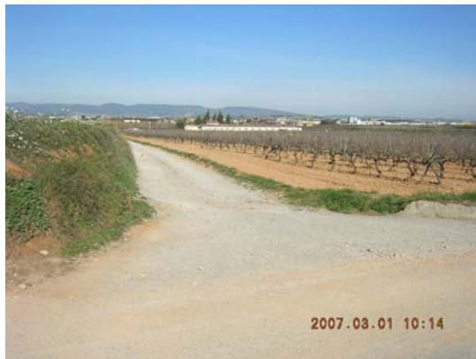
Tram 1: Enllaç Camí Rossend Montané