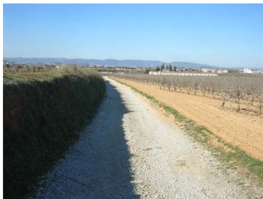
Tram 1: Estat del ferm.