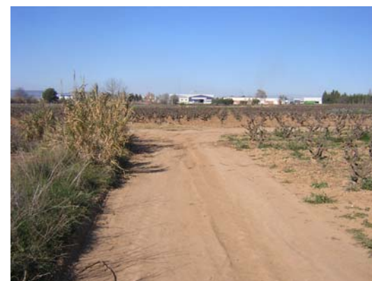
Tram 1: Enllaç camí de Sant Pere Molanta.