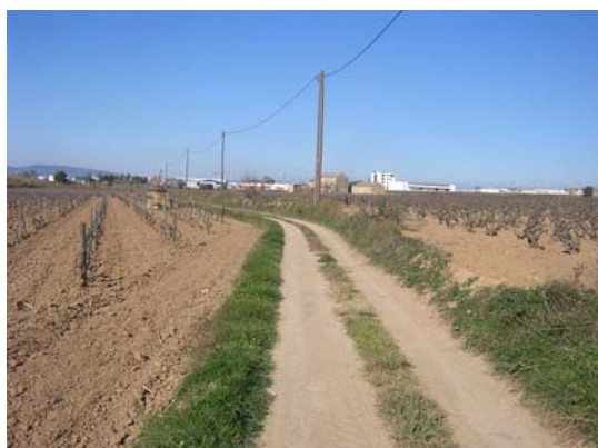
Tram 1: Estat del ferm.