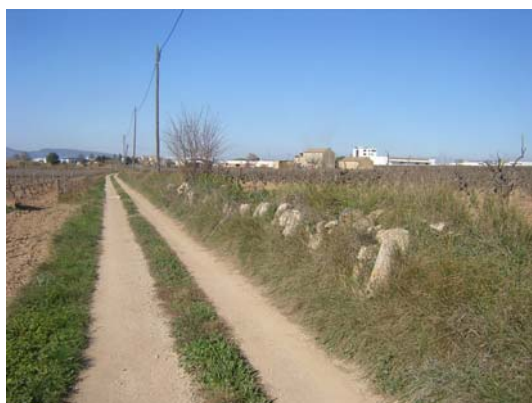
Tram 1: Detall mur de pedra seca.