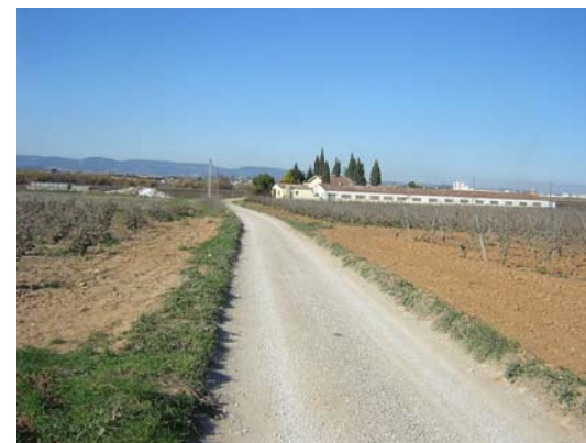
Tram 1: Granja Morros