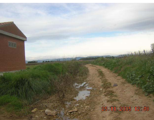
Tram 3: Estat ferm