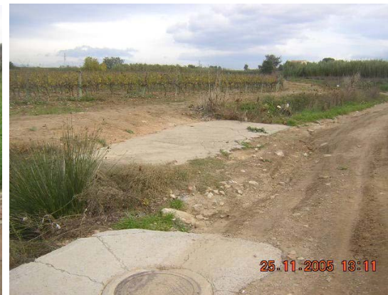
Tram 2: Riera Porroig (i detall col·lector)