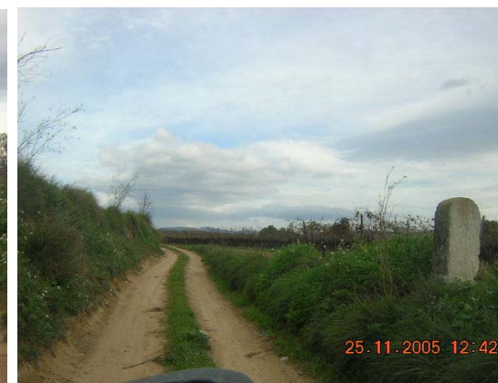
Tram 3: Límit de terme