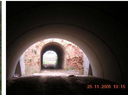
Tram 1: Pas LAV + RENFE