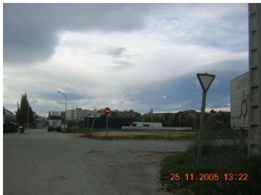
Tram 1: Senyal vertical