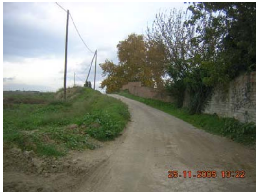
Tram 1: Tipus ferm