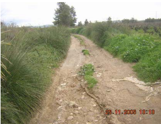
Tram 2: Estat del ferm