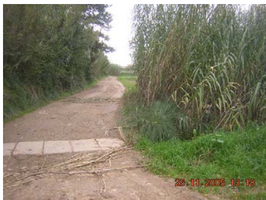
Tram 1: Pas d'aigua riera Adoberia