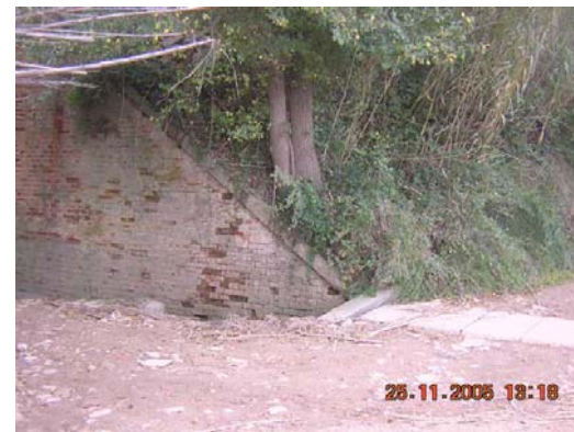
Tram 1: Pas d'aigua riera Adoberia