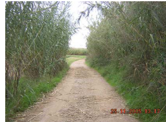
Tram 1: Voltants pas d'aigua riera Adoberia.