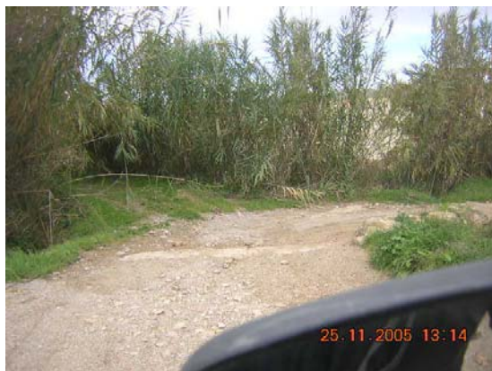
Tram 1: Pas d'aigua riera Porroig