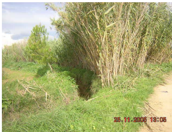
Tram 2: Riera de Porroig (bifurcació)