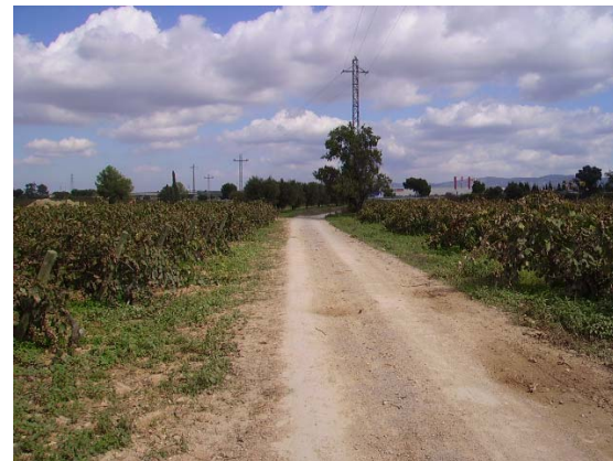
Tram 1: Tipus ferm.