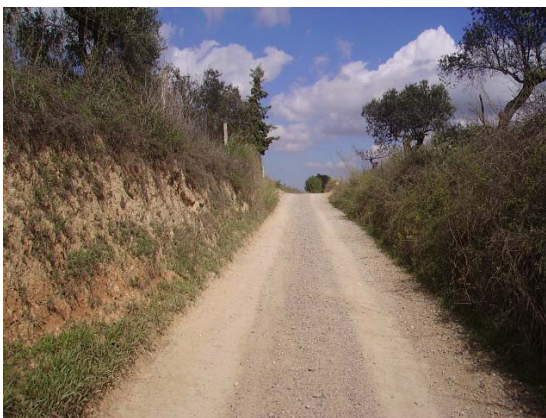
Tram 2: Tipus ferm