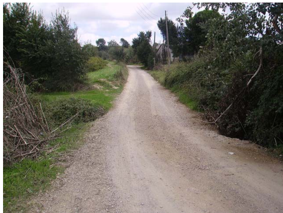
Tram 1: Inici. Pas riera Adoberia.