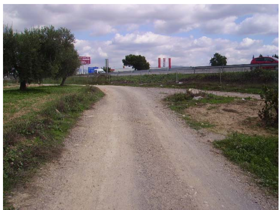
Tram 2: Enllaç al camí lateral nord AP7