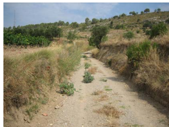
Tram 2. Tipus ferm.