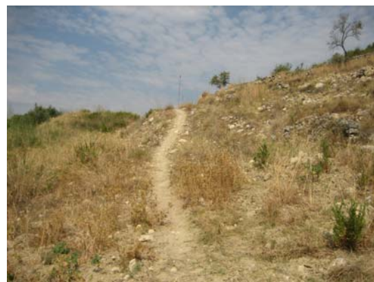
Tram 3: Corriol.