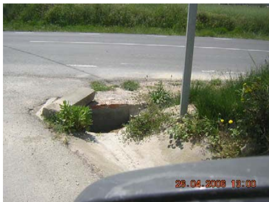
Tram 1: Intersecció amb Ctra. Sant Martí