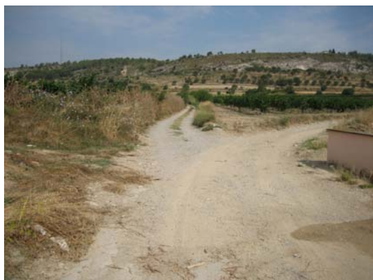
Tram 2: Inici tram