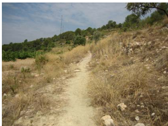
Tram 3. Detall corriol.