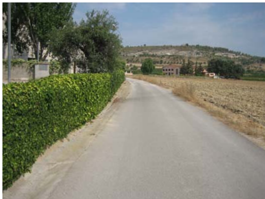
Tram 1: Detall cunetes