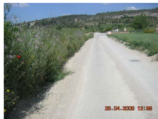
Tram 1. Tipus ferm