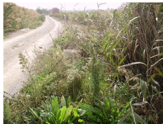
Tram 1: Detall cuneta