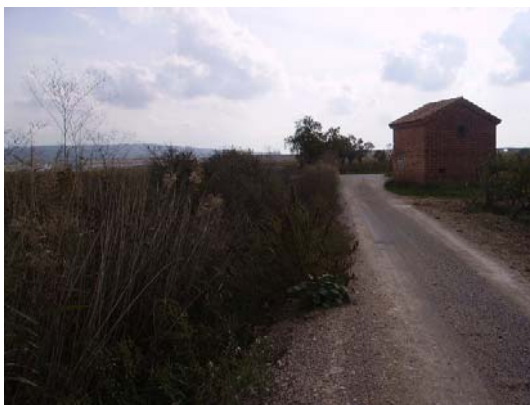
Tram 1: Enllaç Ctra. de la Múnia