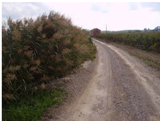
Tram 1: Detall cuneta