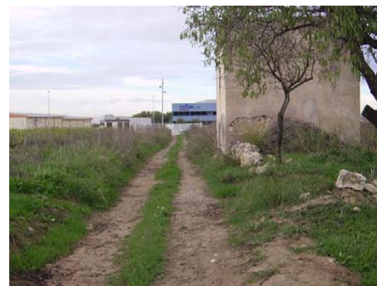
Tram 1: Detall edificació