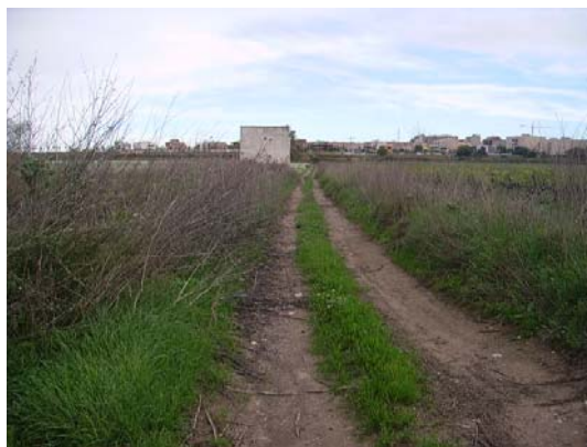
Tram 1: Tipus de ferm