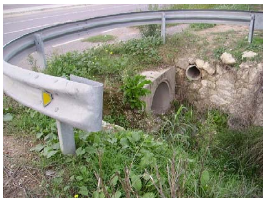
Tram 1: Detall cuneta. Enllaç ctra. de la Múnia