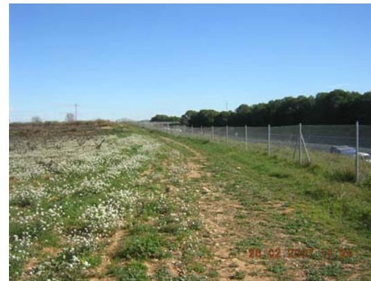
Tram 1: Fi del primer tram. Estat del ferm.