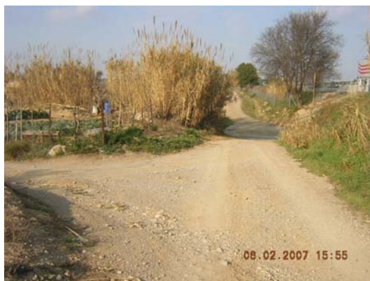
Tram 2: Enllaç camí Mas Rabassa. Gual riera.