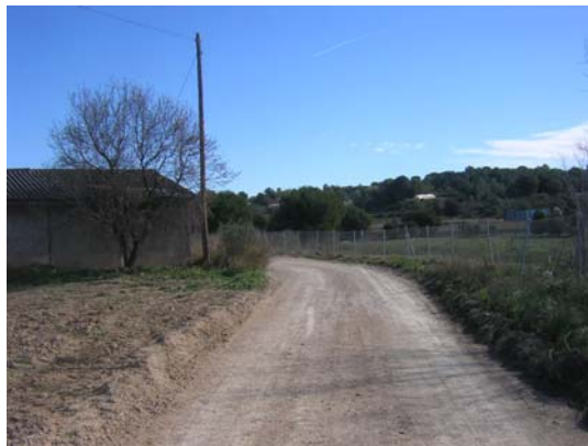
Tram 1: Estat del ferm