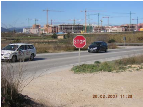
Tram 1: Enllaç C14 i senyalització