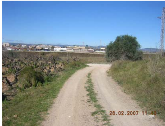
Tram 3: Enllaç camí de Meliό.