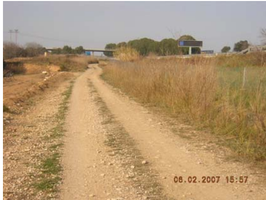
Tram 3: Estat del ferm