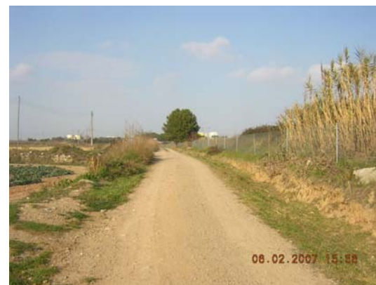
Tram 3: Estat del ferm