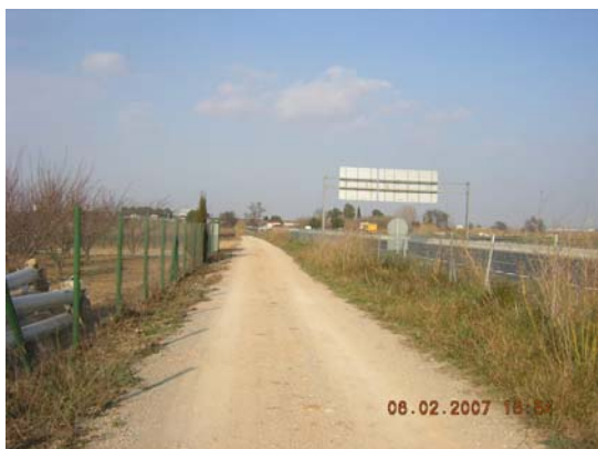
Tram 2: Estat del ferm i tanca AP7