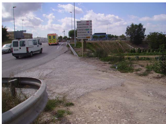
Tram 2: Enllaç Av. Barcelona