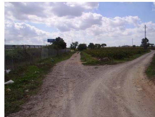
Tram 2: Enllaç amb el camí de l'Hostal Nou