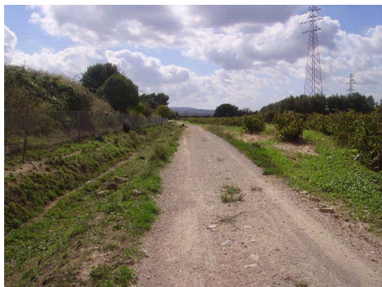
Tram 2: Tram amb cunetes