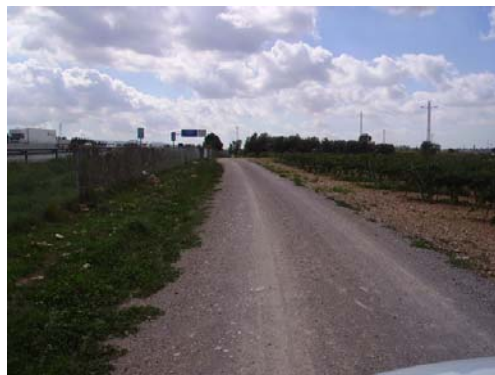
Tram 2: Estat del ferm