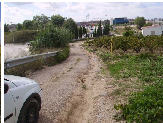
Tram 2: Zona amb major pendent