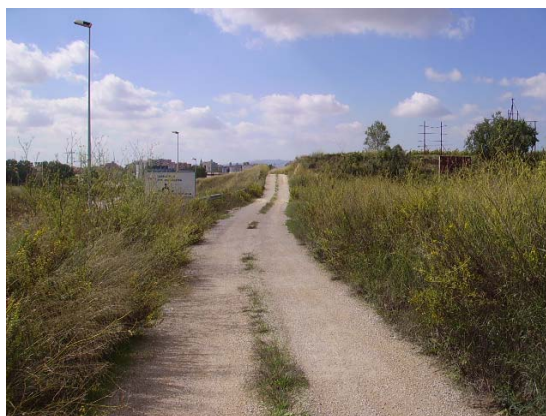
Tram 2: lateral al carril de sortida