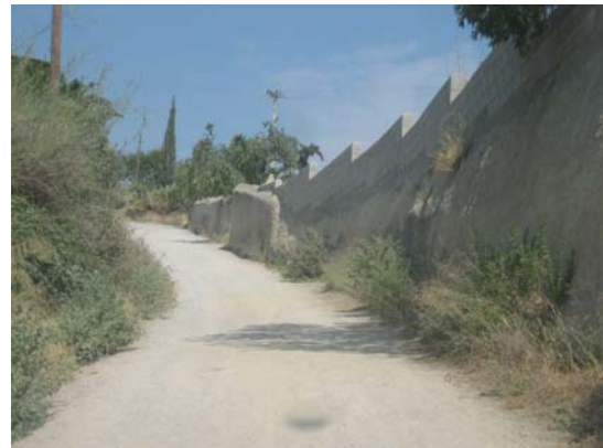
Tram 3: Tipus ferm