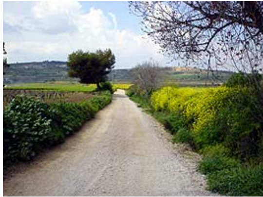
Tram 1: Tipus ferm