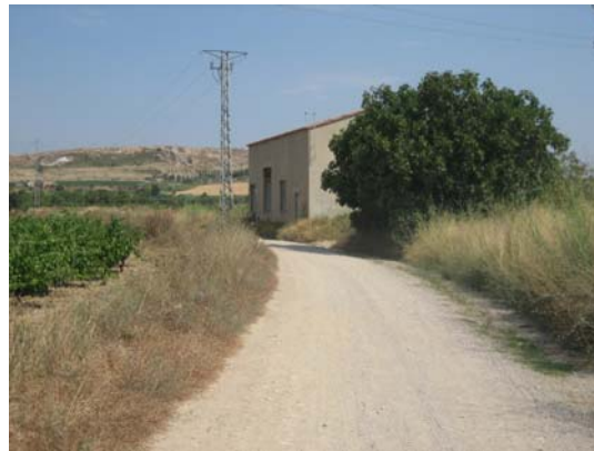
Tram 2. Tipus ferm