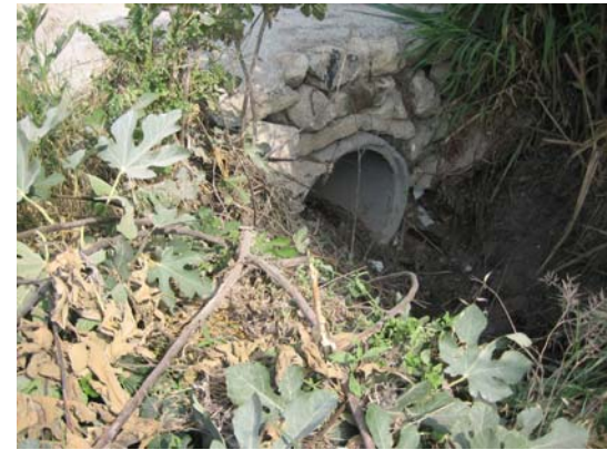
Tram 1. Detall pont.