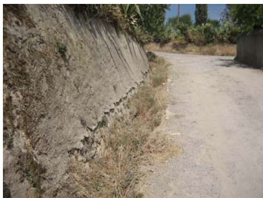
Tram 3. Detall cunetes.