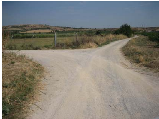
Tram 2: Tipus ferm.