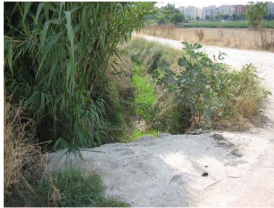
Tram 1: Detall pont.