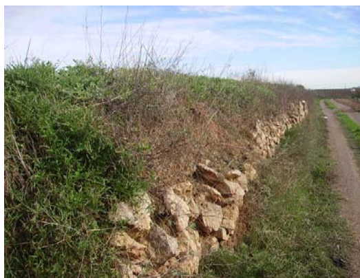
Tram 2: Marge de pedra seca