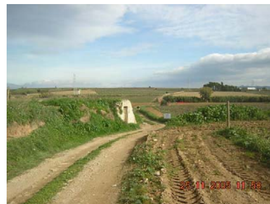
Tram 1: Tipus ferm