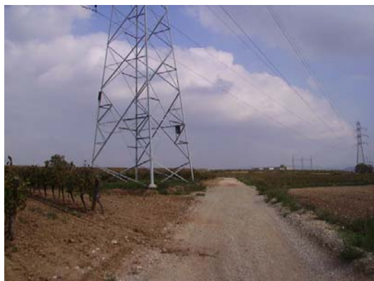
Tram 1: Proximitat torre AT