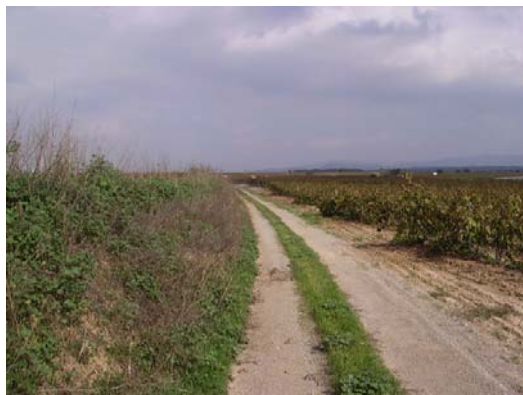
Tram 1: Tipus ferm