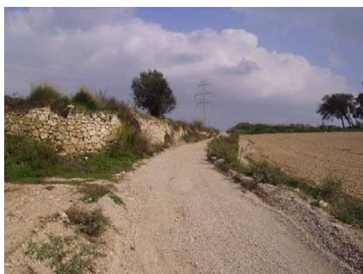
Tram 1: Parcel·la amb paret de pedra seca