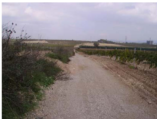
Tram 1: Tipus ferm