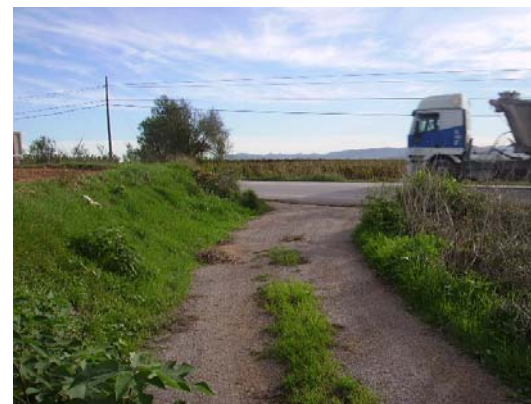
Tram 2: Enllaç amb la ctra. d'Igualada