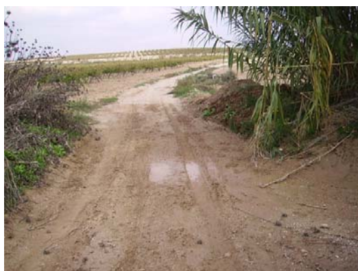
Tram 1: Intersecció riera Adoberia