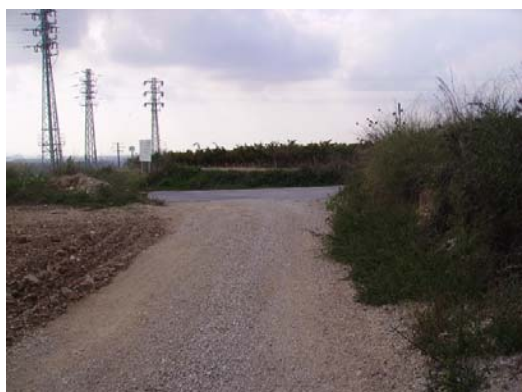
Tram 1: Enllaç ctra. les Cabanyes