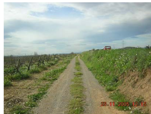
Tram 1: Tipus ferm