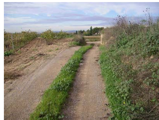
Tram 2: Cruïlla dels cinc camins