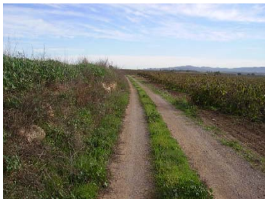
Tram 2: Tipus ferm