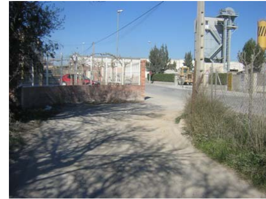
Tram 2: Enllaç P.I. Sant Pere Molanta