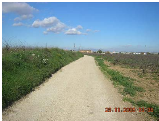
Tram 1: Estat del ferm.