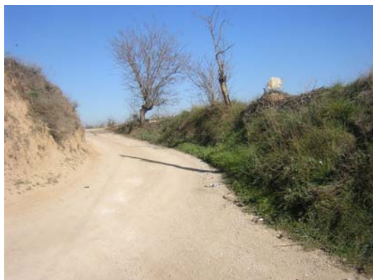
Tram 1: Enllaç camí Meliό i estat del ferm.