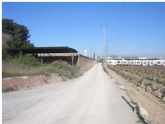
Tram 1: Estat del ferm. Els 5 ponts.