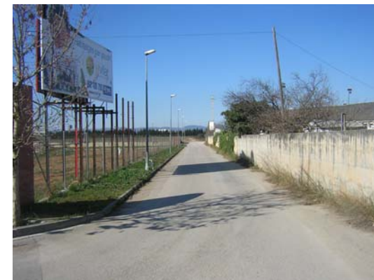
Tram 2: Creu Roja. Tram asfaltat.