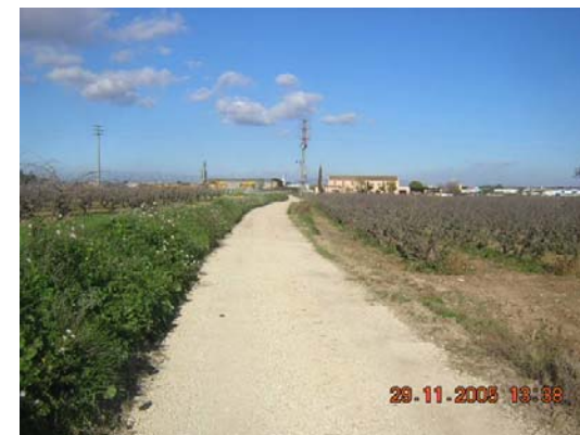
Tram 1: Estat del ferm. Cal Pere Pastor.