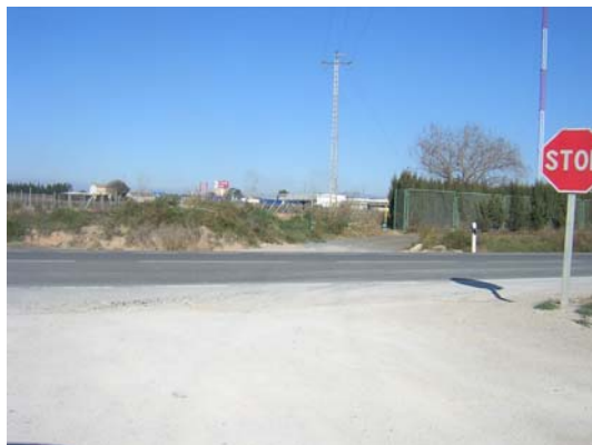
Tram 1: Enllaç N340.