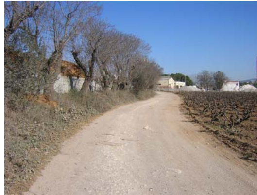
Tram 2: Granja Masó