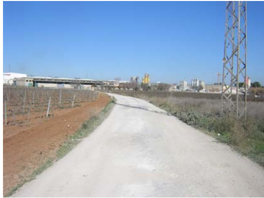
Tram 2: Estat del ferm.