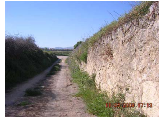
Tram 3: Estat del ferm. Marge de pedra.