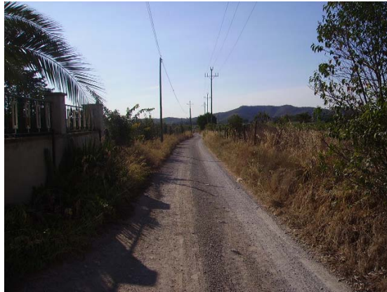
Tram 1: Estat del ferm.