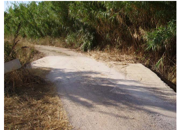
Tram 2: Inters. amb riera de Santa Maria dels Horts