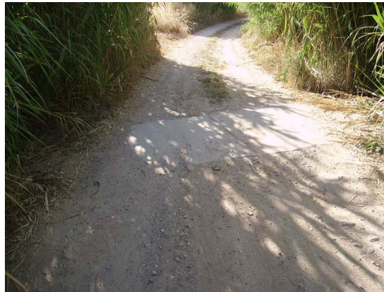
Tram 2: Intersecció amb la riera de l'Adoberia