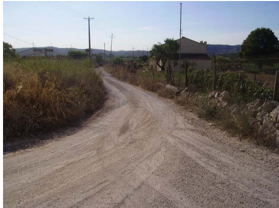
Tram 1: Estat del ferm. Enllaç amb Dr. Fleming