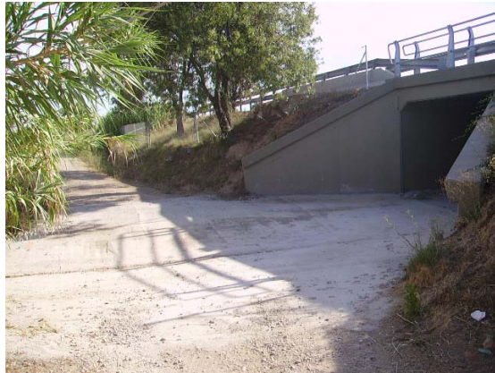
Tram 2: Pont inferior AP7