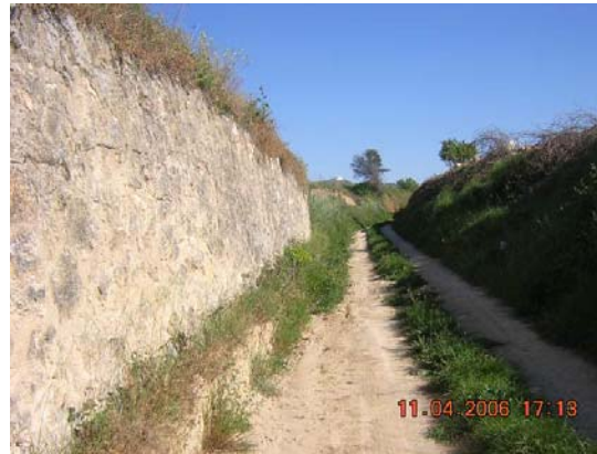
Tram 3: Estat del ferm. Marge de pedra.