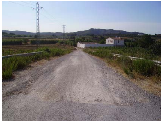
Tram 2: Pont superior N340