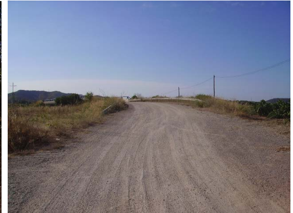
Tram 1: Pont superior N340