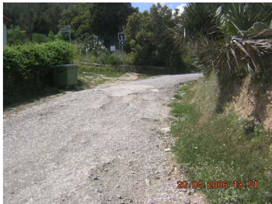
Tram 1. Tram asfaltat.