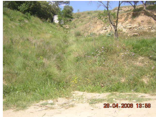
Tram 1. Estat cunetes. Pas d'aigua 2