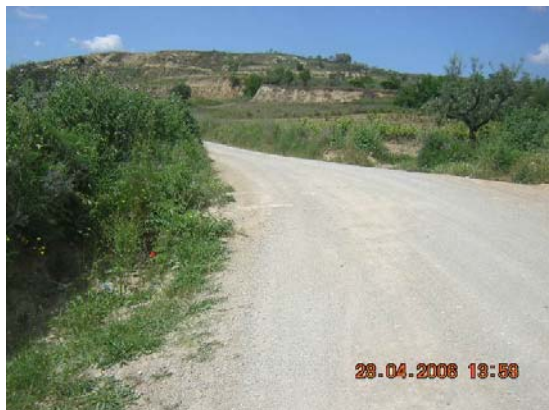
Tram 1: Tipus ferm. Pas d'aigua 3