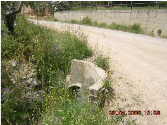
Tram 1: Estat cunetes. Pas d'aigua 1.