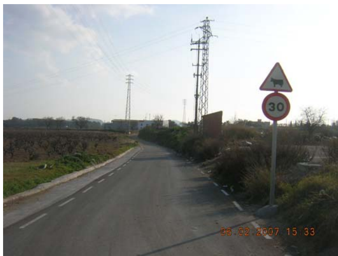
Tram 2: Estat del ferm i senyals verticals.