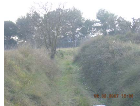
Tram 1: Estat del ferm