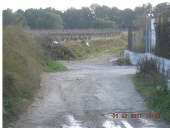
Tram 1: Estat del ferm.