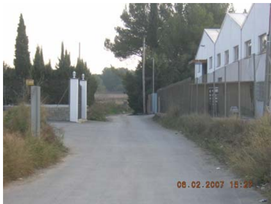
Tram 1: Estat del ferm.