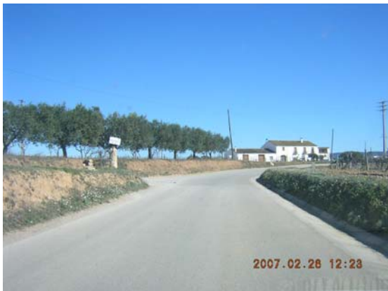
Tram 2: Enllaç camí de Meliό.