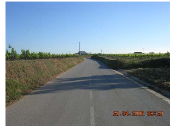
Tram 1: Senyalització horitzontal.