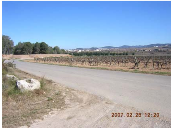
Tram 1: Camí Rossend Montané. Estat del ferm.