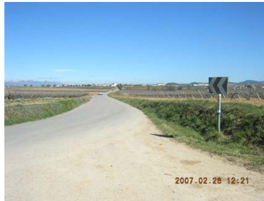
Tram 1: Senyalització vertical.