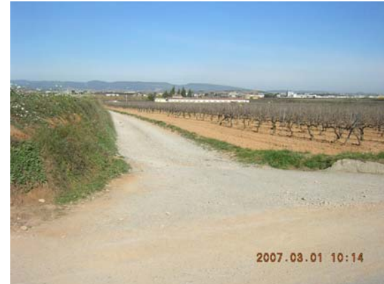
Tram 2: Enllaç Granja Morros.