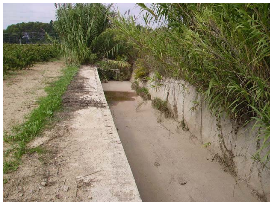
Tram 2. Rasa formigonada.