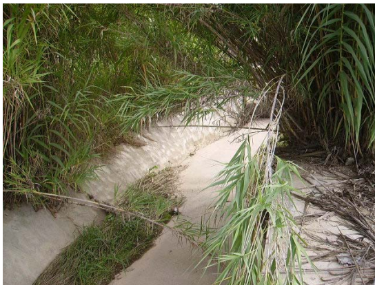
Tram 2. Rasa formigonada.