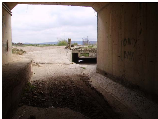
Tram 2. Pas inferior AP7.