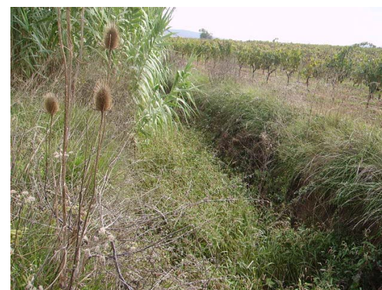
Tram 3. Únicament rasa.