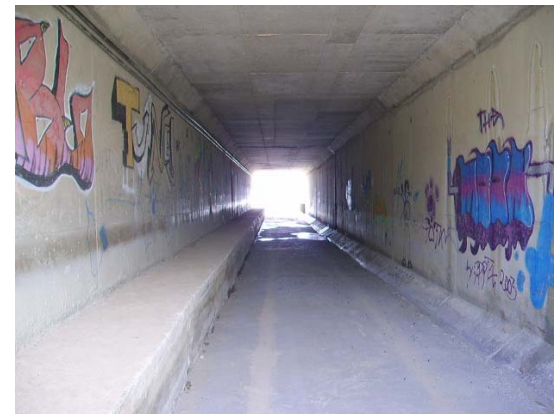
Tram 2. Pas inferior AP7.