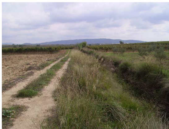
Tram 3. Inici amb camí i rasa lateral