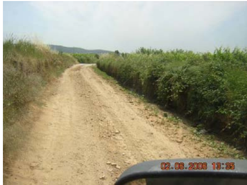
Tram 5. Rasa-camí.