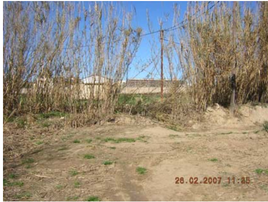
Tram 3: Inici des de la riera.