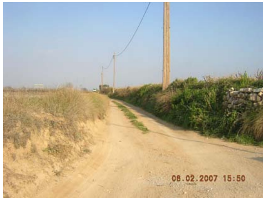
Tram 4: Estat del ferm i marges.