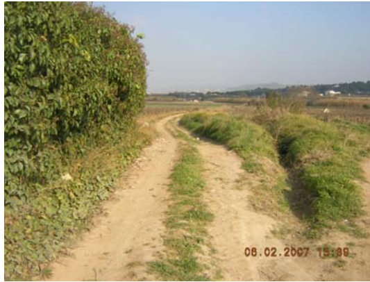
Tram 1: Estat del ferm. Cunetes.