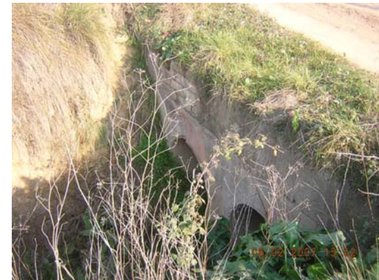
Tram 4: Detall pas d'aigua.