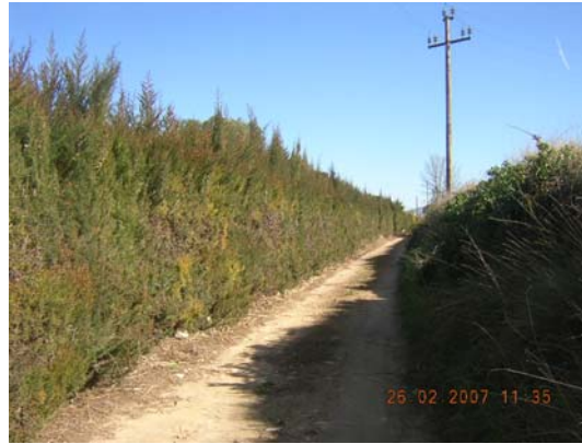
Tram 3: Estat del ferm i marges.