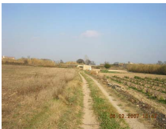
Tram 2: Estat del ferm.