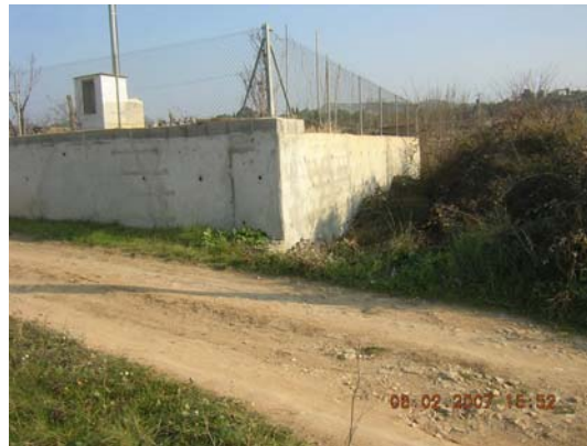
Tram 4: Punt de pas d'aigua.