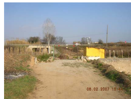
Tram 2: Interrupció camí.