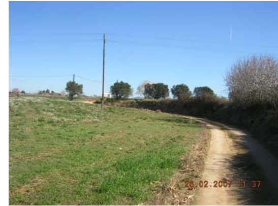
Tram 3: Estat del ferm.