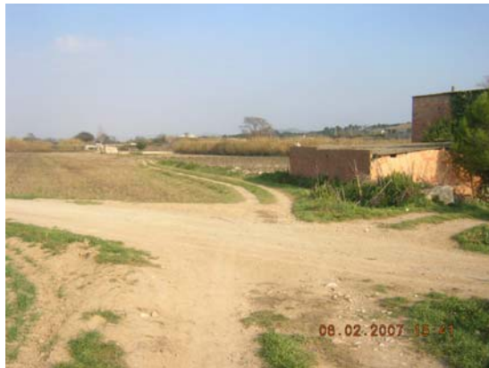
Tram 1: Enllaç camí Pedrera.