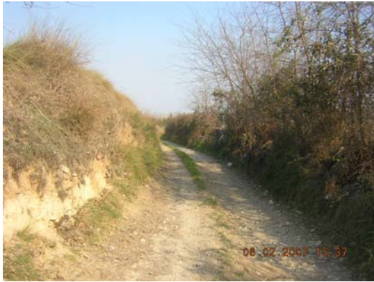
Tram 1: Estat del ferm i marges.