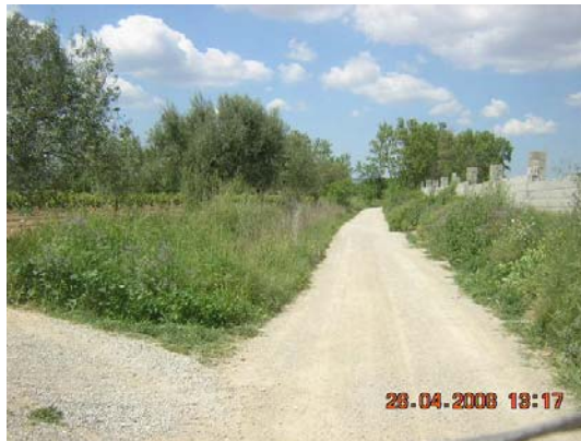
Tram 1: Parcel·la vallada