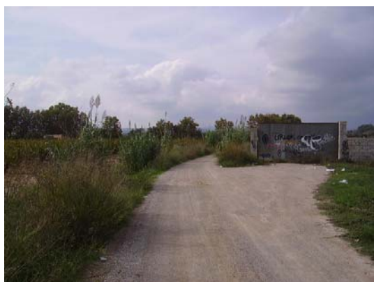
Tram 1: Parcel·la vallada