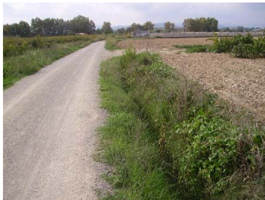
Tram 1: Detall cuneta