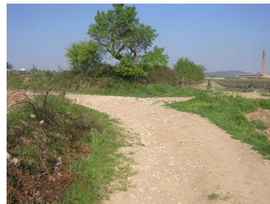
Tram 1: Final del camí