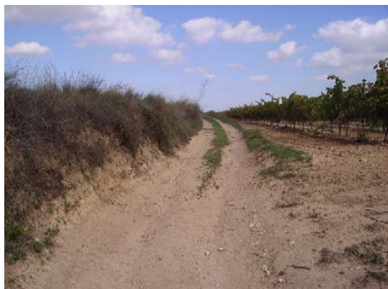
Tram 2: Tipus ferm