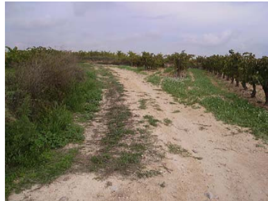
Tram 1: Tipus ferm