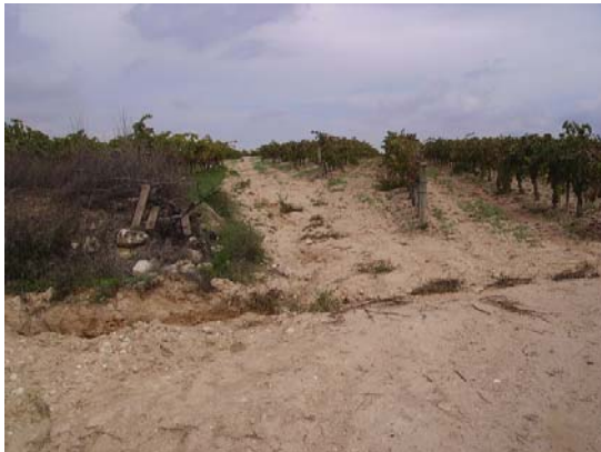
Tram 1: Tipus ferm. Terreny llaurat.