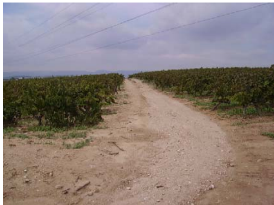
Tram 1: Tipus ferm