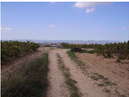
Tram 2: Tipus ferm