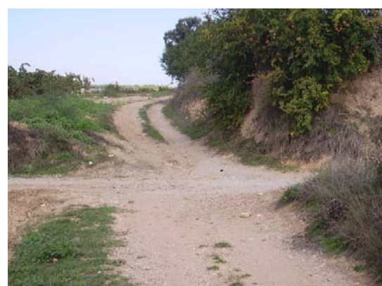
Tram 2: Límit de terme