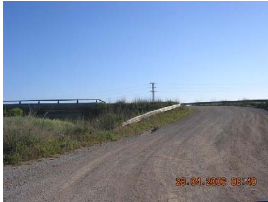
Tram 1: Estat del ferm i pont superior N340