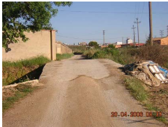
Tram 1: Estat del ferm. Pontó riera de l'Adoberia