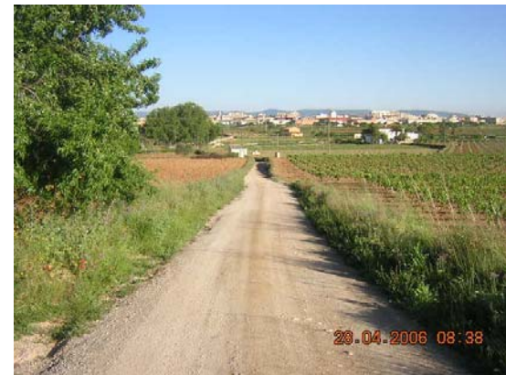
Tram 2: Estat del ferm