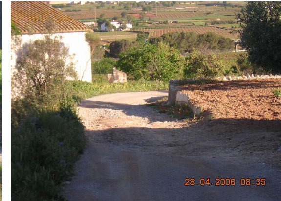
Tram 3: Estat del ferm