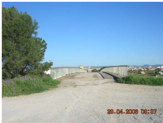
Tram 2: Pont superior AP7