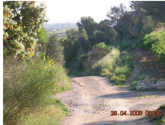
Tram 3: Estat del ferm