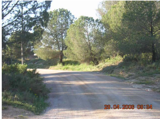
Tram 4: Estat del ferm