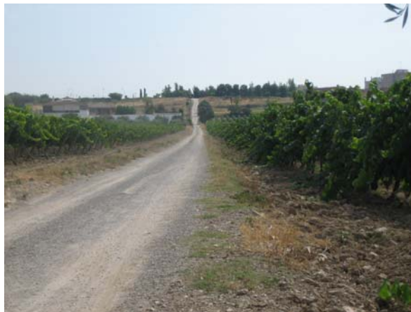
Tram 1: Perspectiva