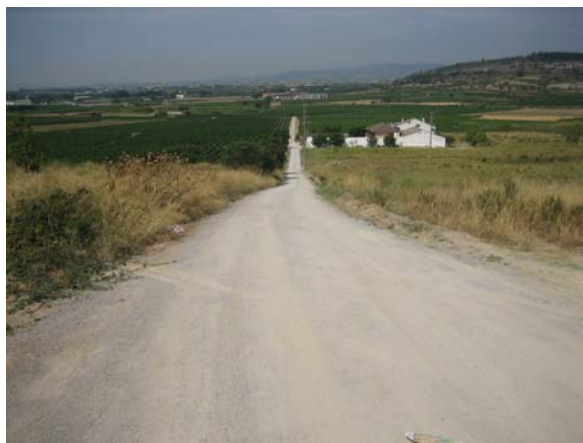
Tram 1. Tipus ferm.