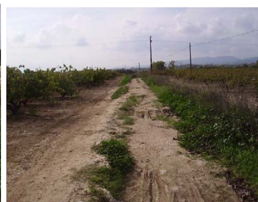
Tram 1: Estat del ferm i marges