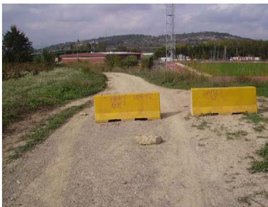
Tram 1: Tanca i estat del ferm