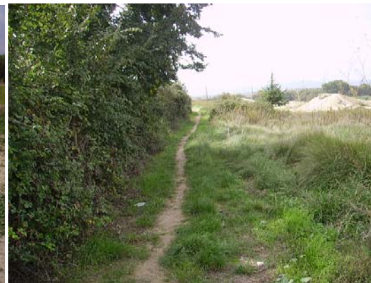
Tram 1: Estat del ferm i marges