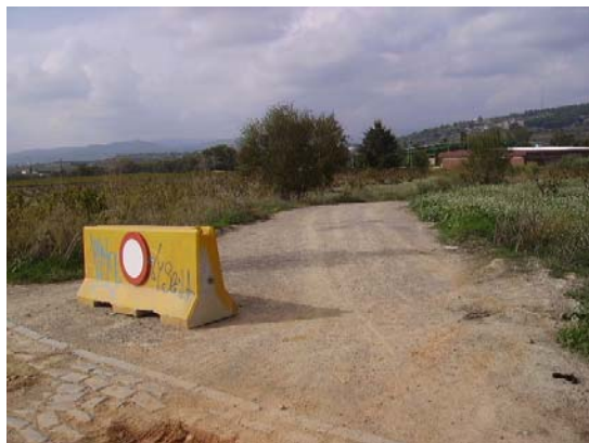
Tram 1: Tanca i estat del ferm