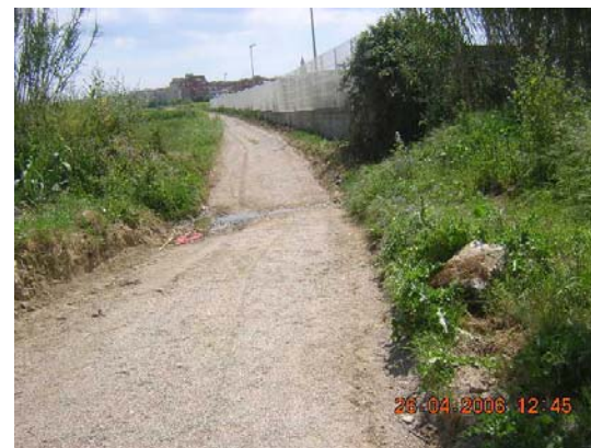
Tram 1. Gual amb riera dels Vinots.