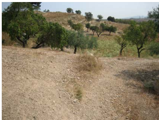
Tram 3. Enllaç amb el Camí de Sant Pau 2.