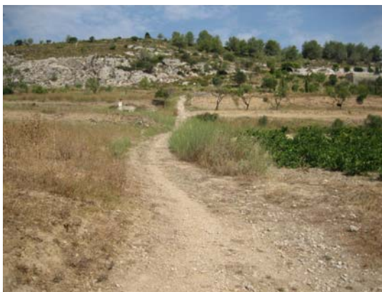
Tram 3: Tipus ferm