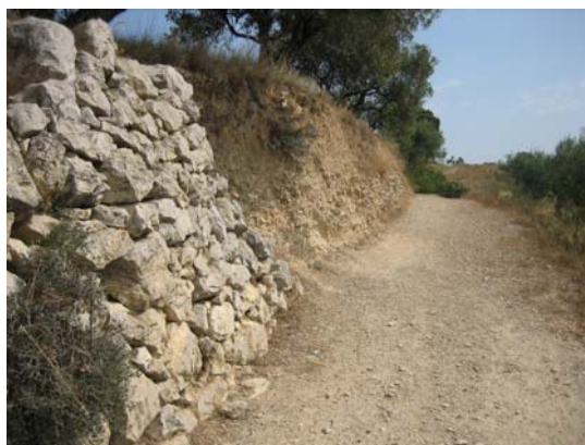
Tram 2. Tipus ferm.