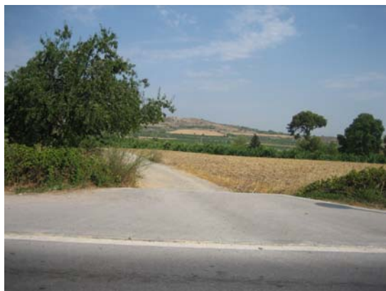
Tram 1. Enllaç amb Balcó de les Clotes.