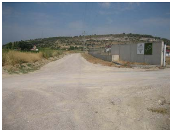
Tram 1: Celler cooperatiu