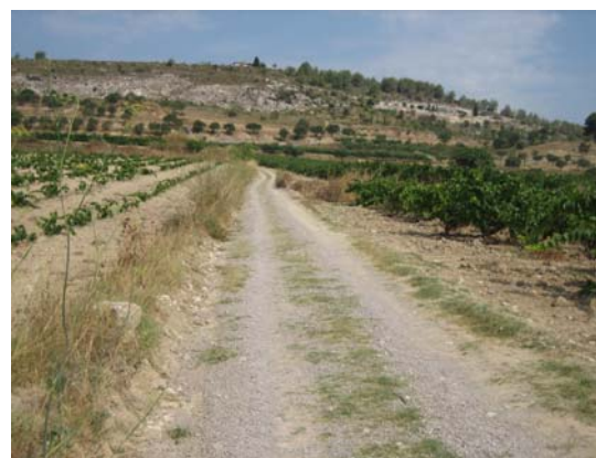
Tram 2: Marge de pedra seca