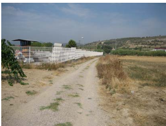
Tram 1: Estat del ferm.