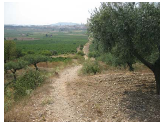
Tram 1. Perspectiva.