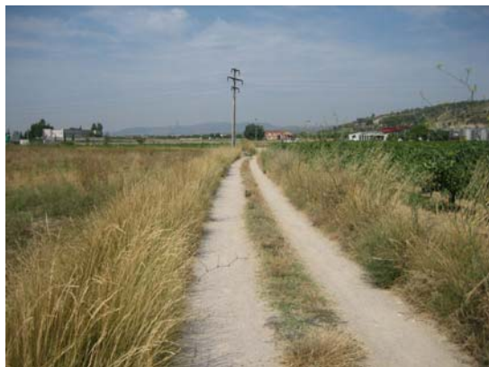
Tram 1: Tipus ferm.