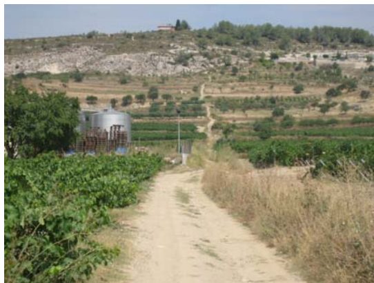
Tram 1: Perspectiva