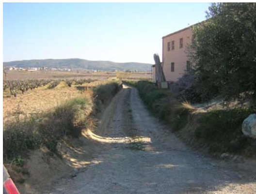
Tram 2: Enllaç camí Porroig. Cal Pere Pastor.