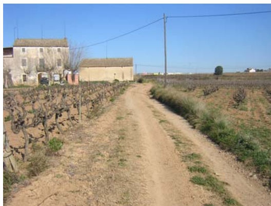
Tram 3: Cal Ferret