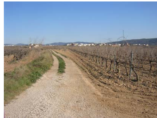
Tram 2: Estat del ferm