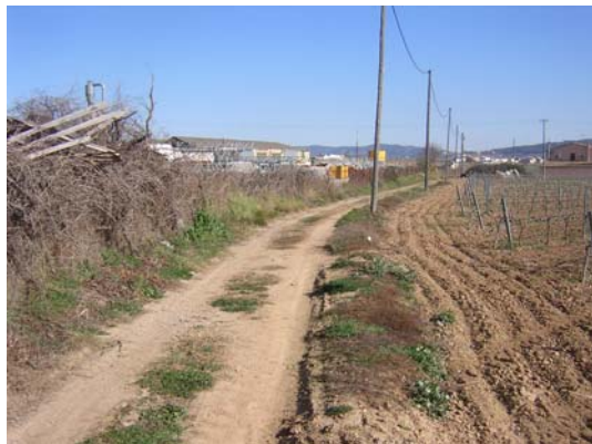
Tram 1: Estat del ferm i línia FECSA