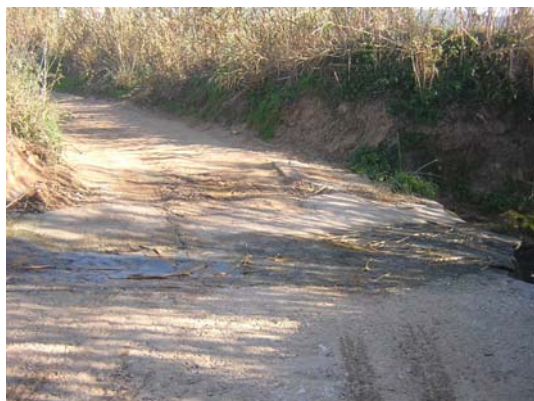
Tram 2: Gual riera Sta. Maria dels Horts