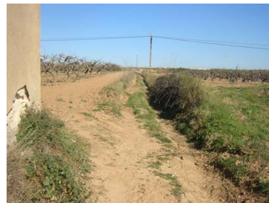
Tram 3: Estat del ferm