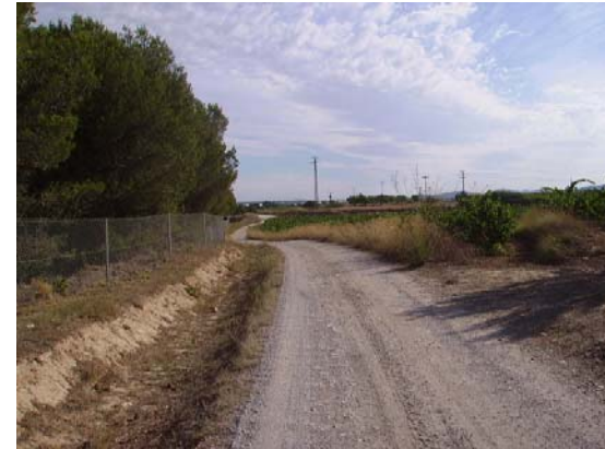
Tram 2: Estat del ferm.