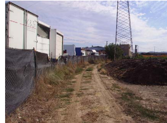
Tram 4: Estat del ferm.