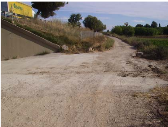
Tram 3: Intersecció amb la riera de Santa Maria