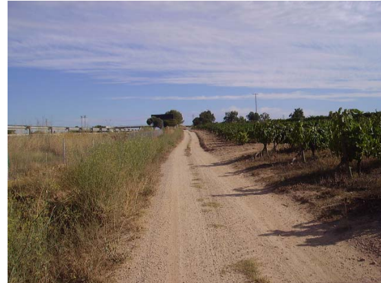
Tram 3: Estat del ferm