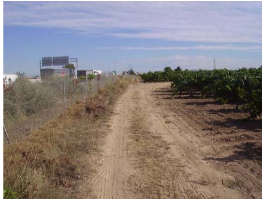
Tram 4: Estat del ferm.