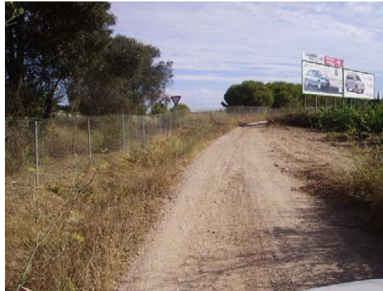
Tram 1: Estat del ferm.