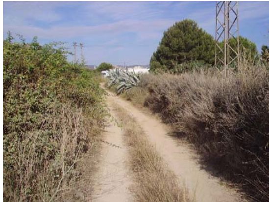
Tram 4: Estat del ferm