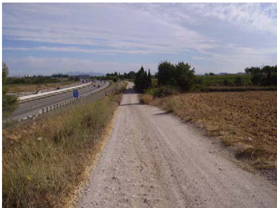
Tram 2: Estat del ferm