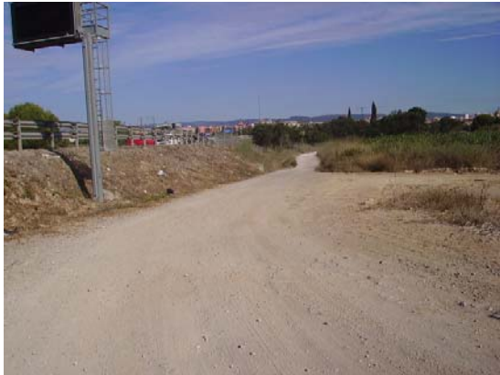
Tram 1: Estat del ferm. Enllaç amb C15