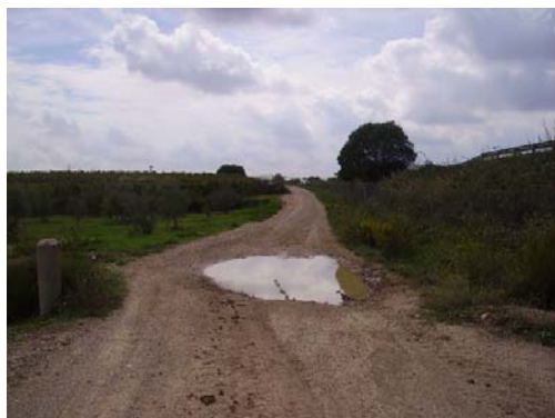
Tram 1: Inici. Intersecció riera dels Segols.