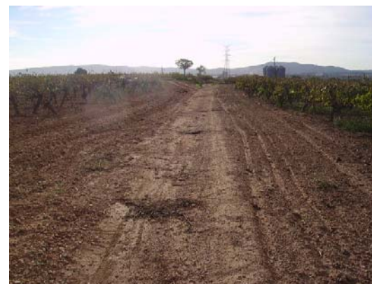
Tram 2: Tram de camí llaurat