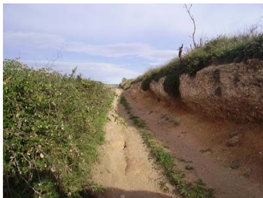
Tram 2: Tipus de ferm