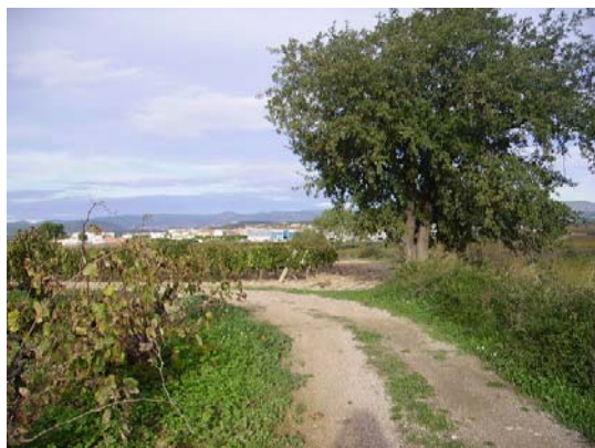
Tram 2: Tipus de ferm