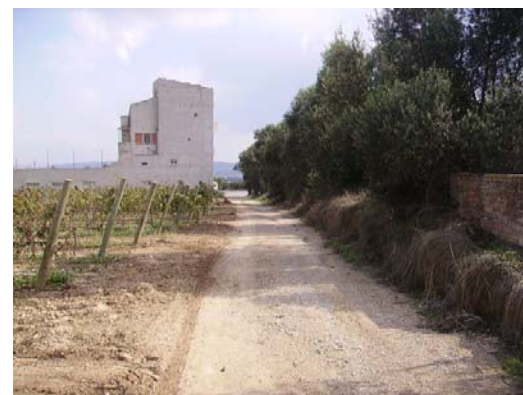
Tram 3: Enllaç ctra. Igualada (actual C14)