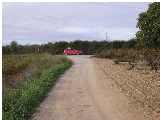
Tram 1: Enllaç ctra. de les Cabanyes