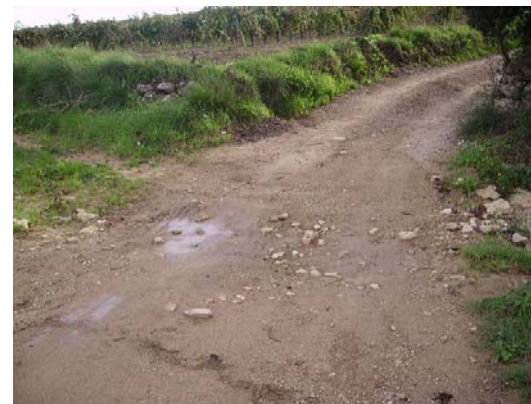
Tram 1: Intersecció riera Adoberia