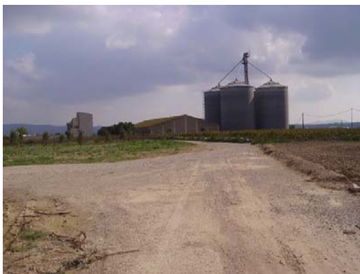
Tram 3: Accés a la subestació FECSA ENDESA