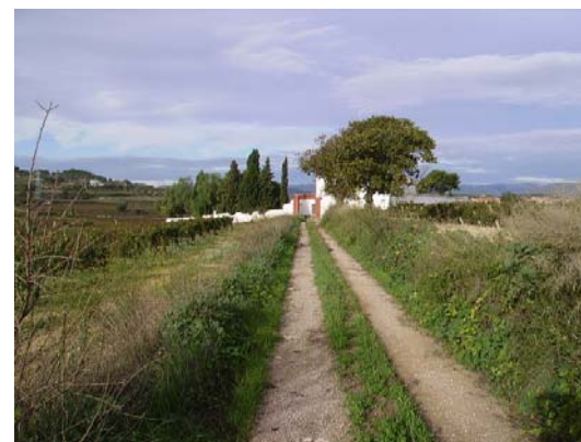
Tram 2: Torreta dels Bous, panoràmica