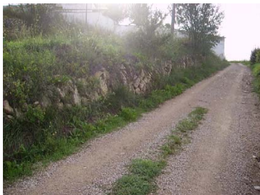
Tram 2: Marge de pedra