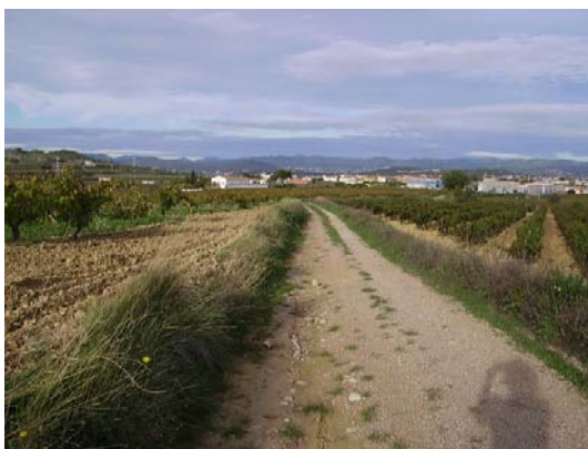
Tram 2: Tipus de ferm