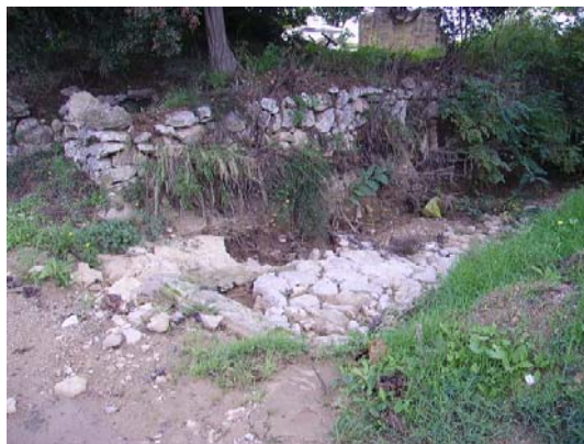
Tram 1: Intersecció riera Adoberia