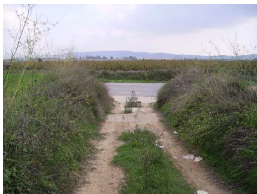
Tram 4: Enllaç ctra. Sant Sadurní