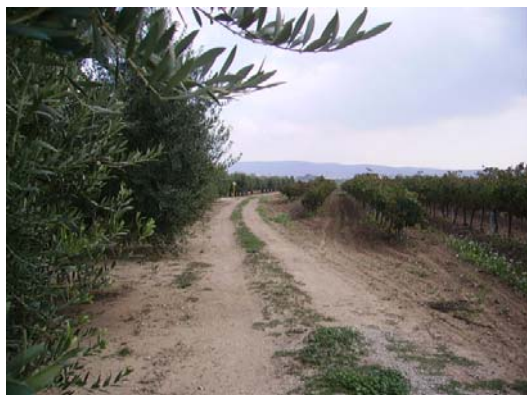
Tram 4: Tipus de ferm