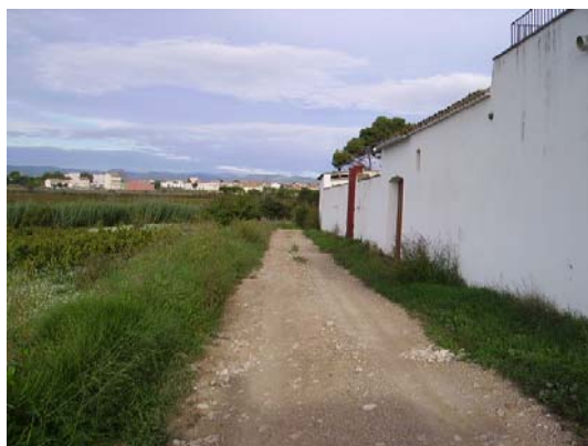
Tram 2: Torreta dels Bous