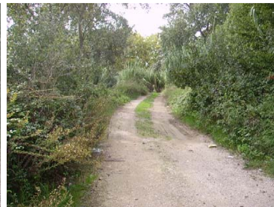
Tram 1: Estat del ferm i cunetes (riera)