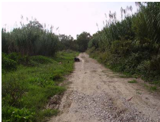
Tram 1: Detall cuneta